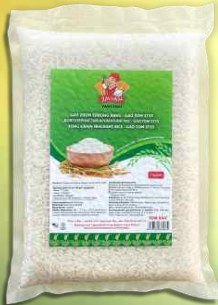
Рис Gaotom ST25