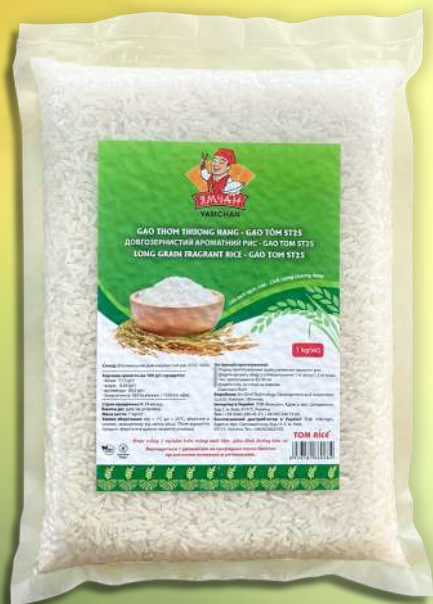
Рис Gaotom ST25